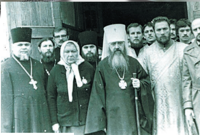
Епископ Зарайский Ювеналий с духовенством и прихожанами Благовещенского храма. 1960-е гг.

в советское время маршрут крестного хода был значительно сокращён: от действующего Благовещенского храма — до городского кладбища, и только.