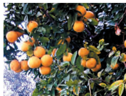
Мандарины в монастыре Колодца Иакова в Наблусе. Территория монастыря Двенадцати апостолов на берегу Тивериадского озера напоминает райский сад. У алтаря храма растёт огромная шелковица. Фото О. Полянчевой, февраль 2015 г.

Сюда можно отнести растения, которые употреблялись в качестве строительных материалов и шли на различные поделки. Это ситтим (аравийская акация), из которой были сделаны принадлежности в скинии Моисея; кедр ливанский, кипарисы и маслины, из стволов которых были построены храм и дворец Соломона. Упоминаются дуб, тополь, миндаль и явор, из которых делали трости. Часто фигурируют стебли иссопа; они употреблялись в качестве тростей, прутья шли на кропила. Встречаются в Библии и благовонные растения: корица, нард (восточная валериана), мирра (благовонная смола).