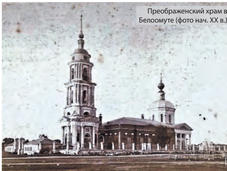
Преображенский храм в Белоомуте (фото нач. XX в.)