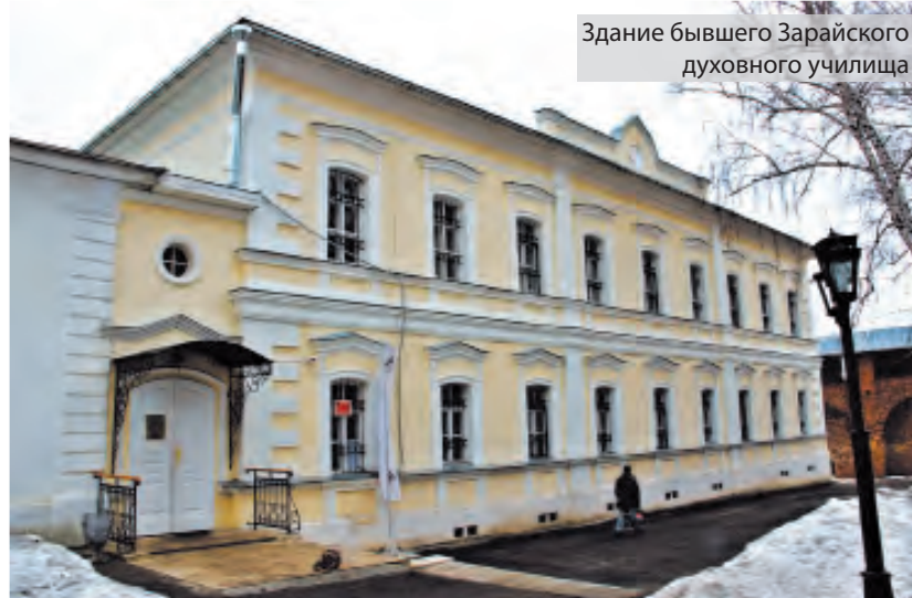
Здание бывшего Зарайского духовного училища