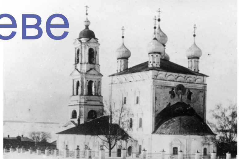
Спасо-Преображенский храм г. Зарайска. Фото нач. XX в.

О жизни наших новомучеников — священнослужителей, пострадавших в годы гонений XX века, мы знаем совсем немного. Их жития обычно весьма кратки: родился в таком-то году в верующей семье, обучался в духовной семинарии, служил в таких-то храмах, арестован по клеветническому доносу, обвинений в контрреволюционной деятельности не признал, приговорён к ссылке на 10 лет без права переписки или к высшей мере наказания... Вот и все сведения! Поэтому, если обнаруживается какой-либо новый документ или факт биографии, жизнь каждого новомученика становится для нас более полной, близкой и понятной.