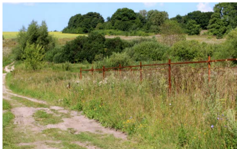
Деревня Астрамьево. Просёлочная дорога ведёт к кладбищу, рядом с которым, на возвышенности справа, некогда стояла деревянная Казанская церковь. Фото 2018 г.

P.S. Автор выражает благодарность сотрудникам Архивного отдела администрации г.о. Зарайск за помощь в работе.