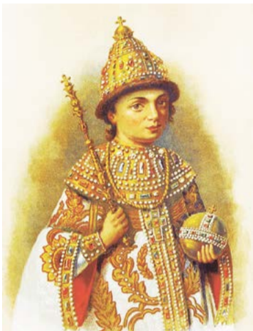
Пётр был провозглашён царём в десятилетнем возрасте

В январе 1648 г. государь предпринимает вторую попытку жениться — на этот раз выбор остановился на Марии Милославской. Царица Мария родила ему двух сыновей — Фёдора