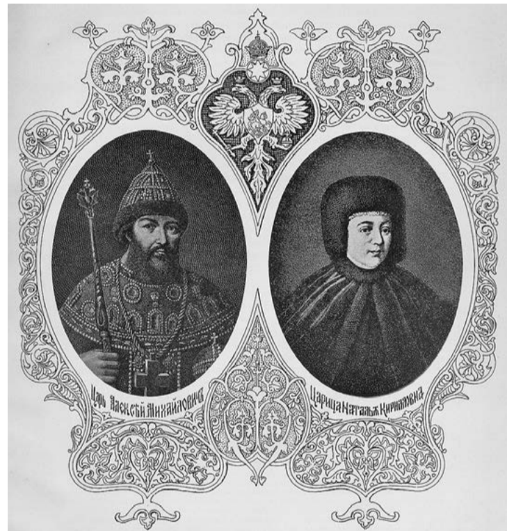
Царь Алексей Михайлович и царица Наталья Кирилловна

Между тем счастье молодой четы длилось лишь пять лет — в январе 1676 г. Алексей Михайлович неожиданно скончался. И вскоре кроткая царица и весь род Нарышкиных подвергся жесточайшим преследованиям буйных стрельцов; жизнь Ната-