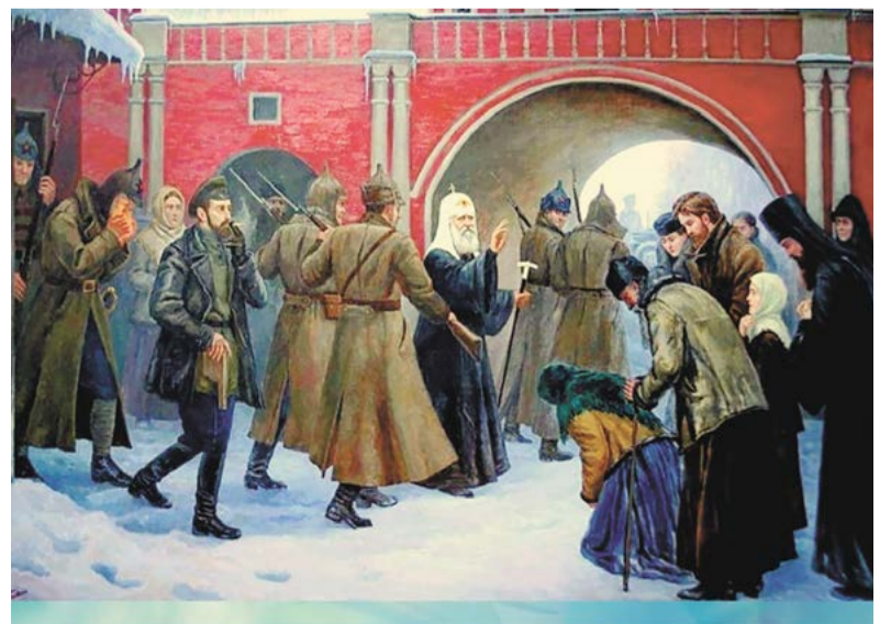
Арест Патриарха Тихона

Изъятие большевистской властью церковных ценностей в 1922 году стало одним из самых скорбных событий истории Российского государства. Тогда под предлогом помощи голодающим регионам страны совершалось крупномасштабное святотатство, разорялись храмы, проходили показательные суды над духовенством.