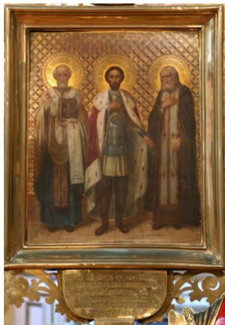
↑ Икона на Хоругви, подаренной арзамасцами

А вот запись, которая относится к Никольской церкви зарайского села Столпово (храм до наших дней не сохранился). В 1885 году была открыта церковно-приходская школа. В ней — «одна классная комната, где находится кафельная печь; в классной комнате — 12 парт, каждая рассчитана на 4 места. В комнате стоят стол и стул для учителя, классная доска, скамейка малого роста и шкаф для книг. Классная комната, длиной и шириной 10 аршин (примерно: 7 x 7 метров) имеет 7 окон». Это интерьер учебного заведения. «Самым драгоценным украшением школы, — продолжаю читать документ, — служат 3 иконы: Спасителя, благословляющего детей, Святителя и Чудотворца Николая и в большом размере святого благоверного князя Александра Невско-