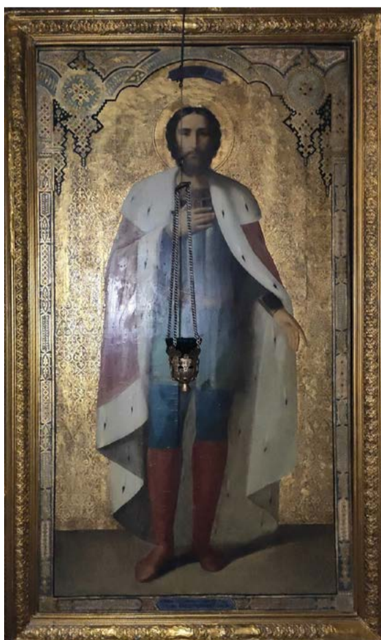
↑ Икона святого князя Александра Невского в зарайском Благовещенском храме