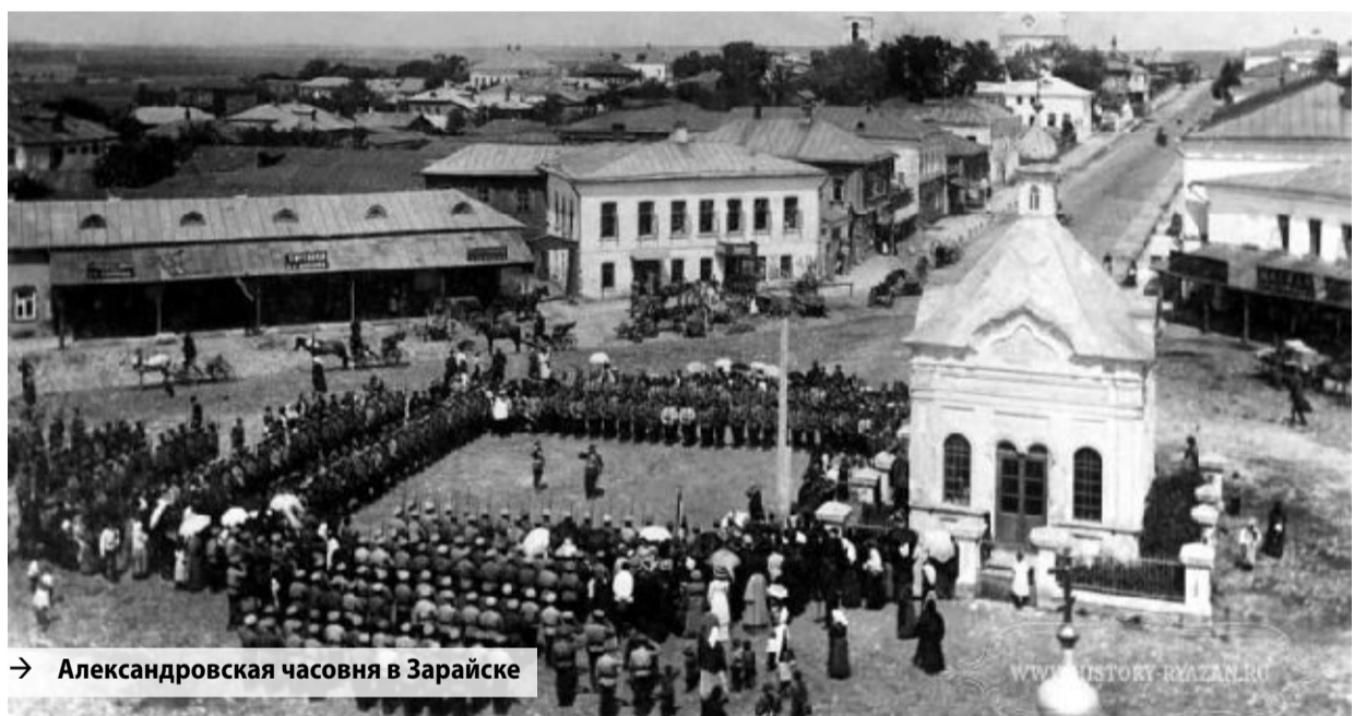
→ Александровская часовня в Зарайске

П ётр I перенесением мощей Александра Невского в Северную столицу придал святому значение небесного покровителя Царствующего Дома. В XIX столетии три российских императора — Александр I, Александр II, Александр III — носили имя святого князя-воина. Эти русские цари были очень популярны в народе: Александр I — как победитель Наполеона, Александра II называли «Освободителем» — за отмену крепостного права, Александра III — «Миротворцем» и «Мужицким царём» — за то, что в годы его правления Россия забыла о войнах, и за богатырское телосложение, простоту и прямодушие.