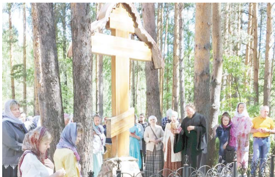
↑ У Поклонного креста в монастыре под Алапаевском

ный Храм-на-Крови Екатеринбурга возведён в начале 2000-х годов на месте бывшего Ипатьевского дома. На нижнем этаже представлена музейная экспозиция, рассказывающая о пребывании на Урале Царской Семьи; один из престолов верхнего храма, погружённый в тёмно-красный полумрак, устроен в размерах «расстрельной комнаты». На заброшенном руднике Ганина Яма теперь действует мужской монастырь в честь Царственных Страстотерпцев. Здесь, среди высоких сосен, построены и освящены семь деревянных храмов — по числу жертв трагедии, установлены памятники Государю Императору, Императрице Александре и их детям. Не скрывая слёз, паломники читали