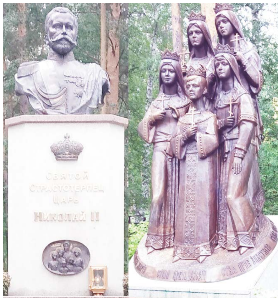
↑ Памятники Царю Николаю II и его детям на Ганиной Яме

Ныне места трагедий отмечены храмами и монастырями, где постоянно возносятся молитвы святым новомученикам; здесь молились и причащались зарайские верующие во время паломничества. Величествен-