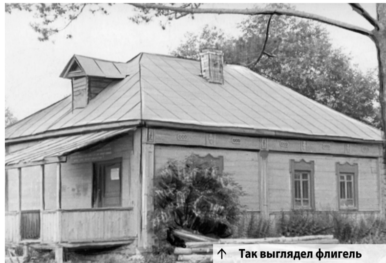
↑ Так выглядел флигель Достоевских в Даровом в середине 1950-х годов.