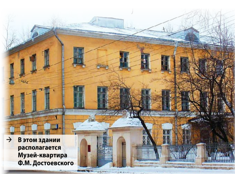
→ В этом здании располагается Музей-квартира Ф.М. Достоевского