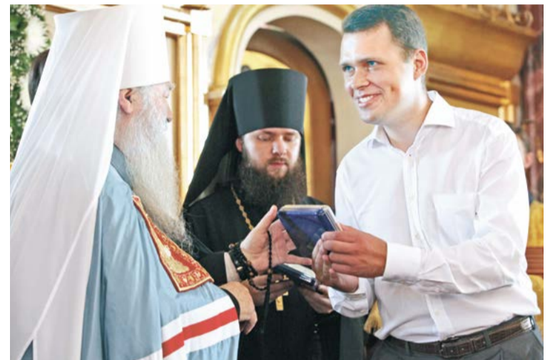
← Великое освящение Успенской церкви в д. Рожново