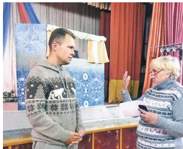
↑ В Протекинском доме культуры