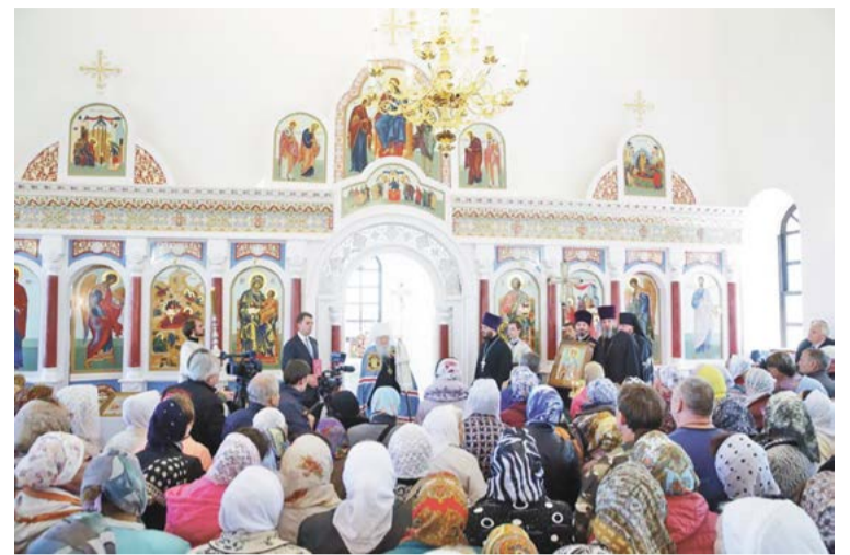
↑ Храм Рождества Богородицы в д. Большие Бельничи