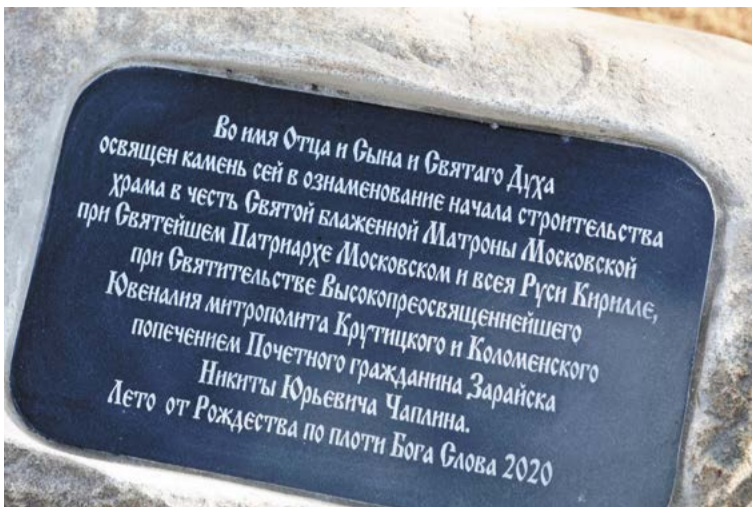
↑ Закладной камень на месте будущего храма во имя св. Матроны Московской в с. Чулки-Соколово