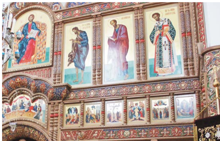
↑ Иконостас храма свт. Василия Рязанского