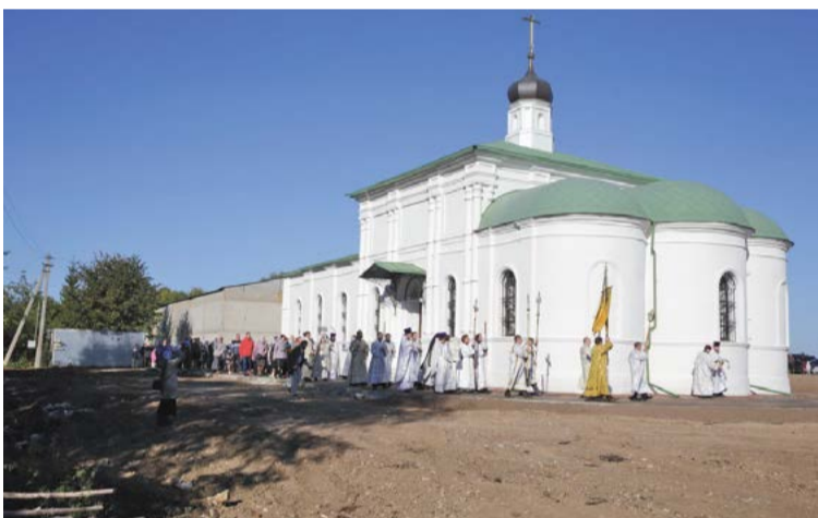
↑ Освящение храма в Больших Бельничах 24 сентября 2017 г.