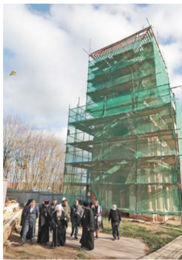
↑ Свято-Духовский храм д. Моногарово в строительных лесах