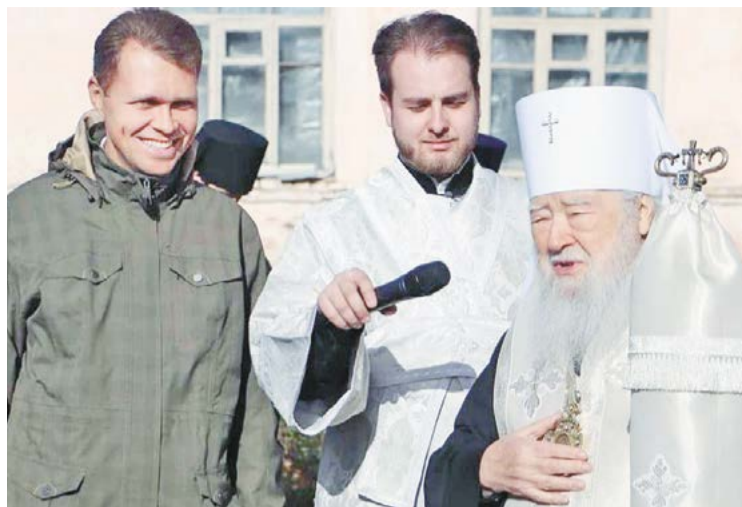
↑ Архипастырское слово после освящения закладного камня