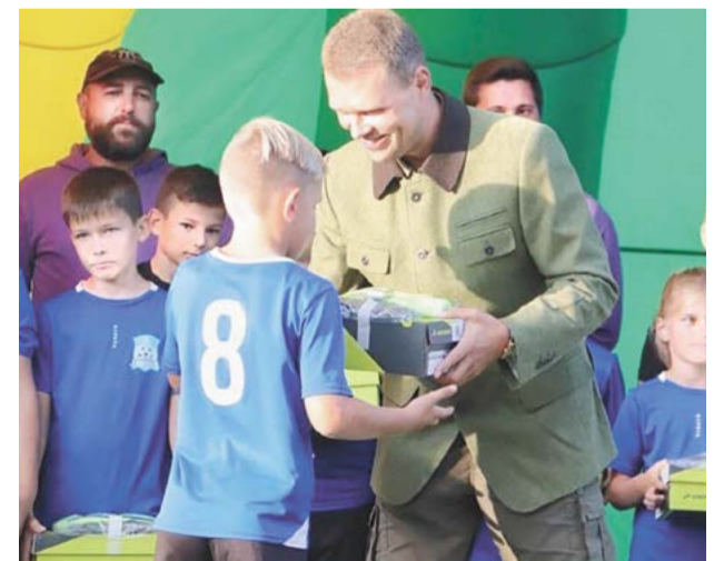
↑ Вручение спонсорской помощи юным спортсменам