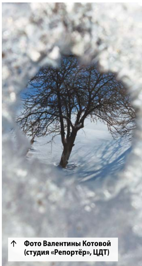
↑ Фото Валентины Котовой (студия «Репортёр», ЦДТ)

Я долго искал это слово — «сфера». Сперва я сказал себе: «Надо расширить границы жизни», но жизнь не имеет границ! Это не земельный участок, огороженный забором — границами. «Расширить пределы жизни» — не годится для выражения моей мысли по той же причине. «Расширить горизонты жизни» — это уже лучше, но всё же что-то не то. Максимилиан Волошин любил хорошее слово — «окоём». Это всё то, что вмещает глаз, что он может охватить. Но и тут мешает ограниченность нашего бытового знания. Жизнь не может быть сведена к бытовым впечатлениям. Надо уметь чувствовать и даже замечать то, что за пределами нашего восприятия, иметь как бы «предчувствие» открывающегося или могущего нам открыться нового. Самая большая ценность в мире — жизнь: чужая, своя, жизнь животного мира и растений, жизнь культуры, жизнь на всём её протяжении — и в прошлом,