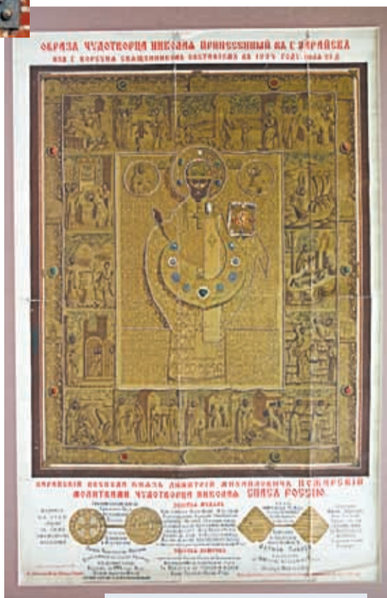
Литография с чудотворной иконы Николая Зарайского (в окладе)

Как удалось малочисленному отряду Пожарского выбить неприятеля, удивляло многих. Иначе, как чудом, нельзя было на-