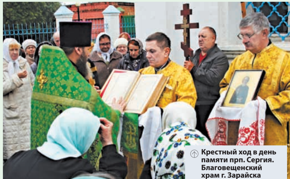
Крестный ход в день памяти прп. Сергия. Благовещенский храм г. Зарайска

Но преподобный был не только покровителем нашей земли и молитвенником о ней. Он известен православным людям и