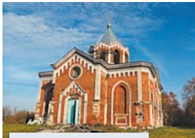
Покровский храм д. Злыхино