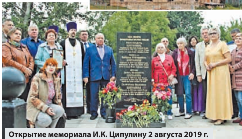
Открытие мемориала И.К. Ципулину 2 августа 2019 г.