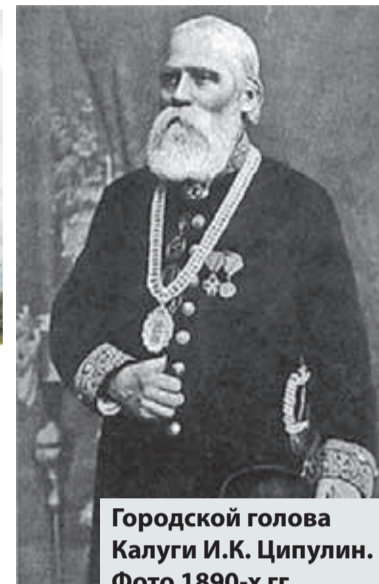
Городской голова Калуги И.К. Ципулин. Фото 1890-х гг.