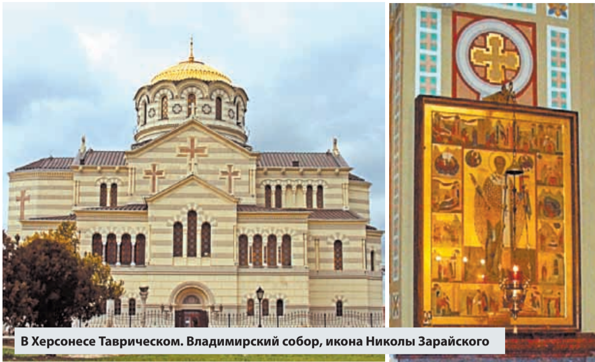
В Херсонесе Таврическом. Владимирский собор, икона Николы Зарайского