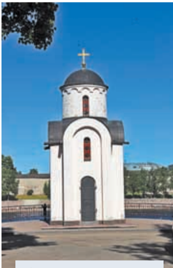
⌚ Часовня св. Ольги на берегу р. Великой