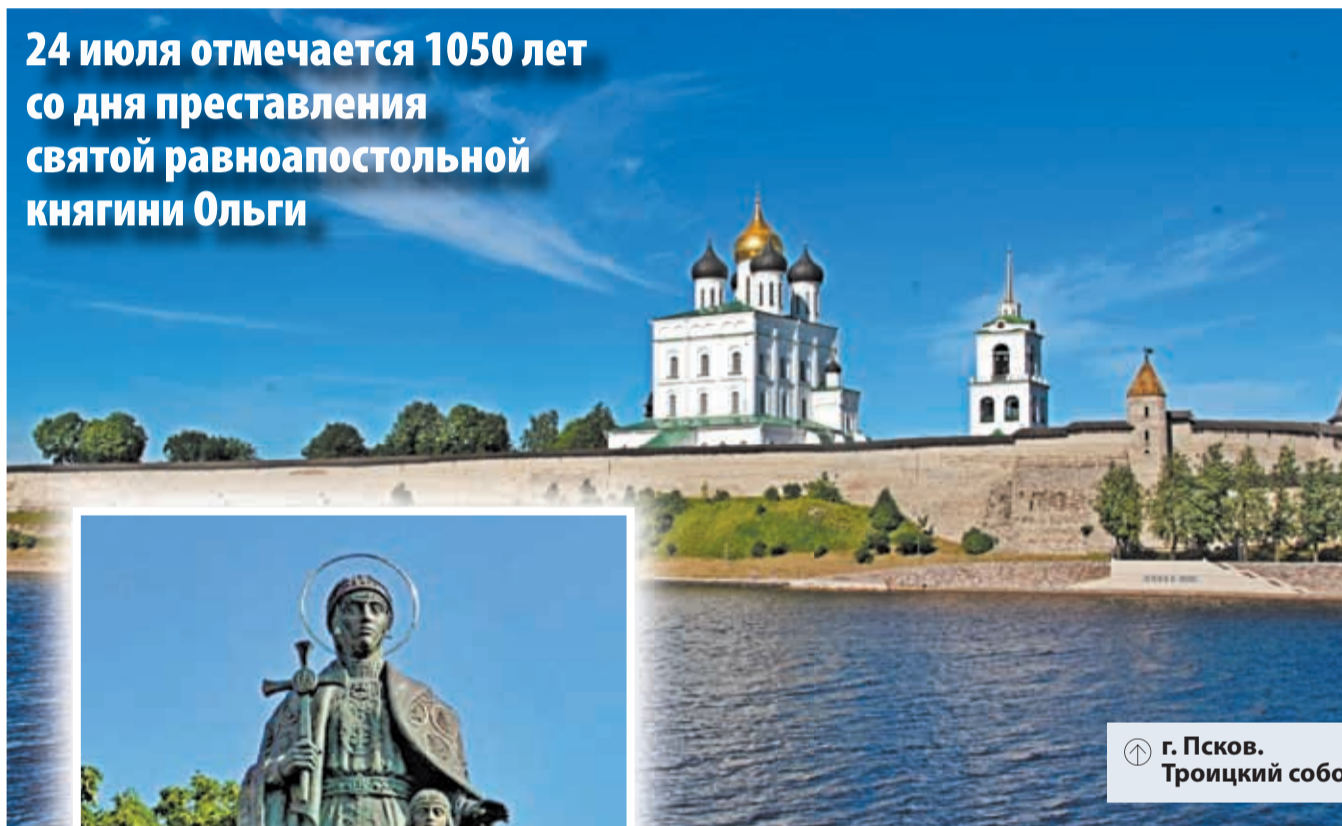
г. Псков. Троицкий собор

24 июля отмечается 1050 лет со дня преставления святой равноапостольной княгини Ольги