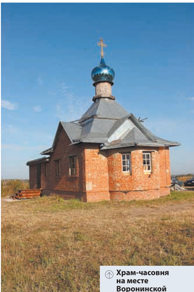
⊕ Храм-часовня на месте Воронинской обители. Фото 2018 г.