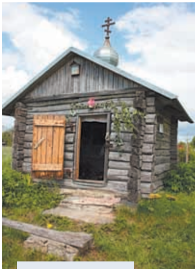
⌚ Часовня на Ольгином поле