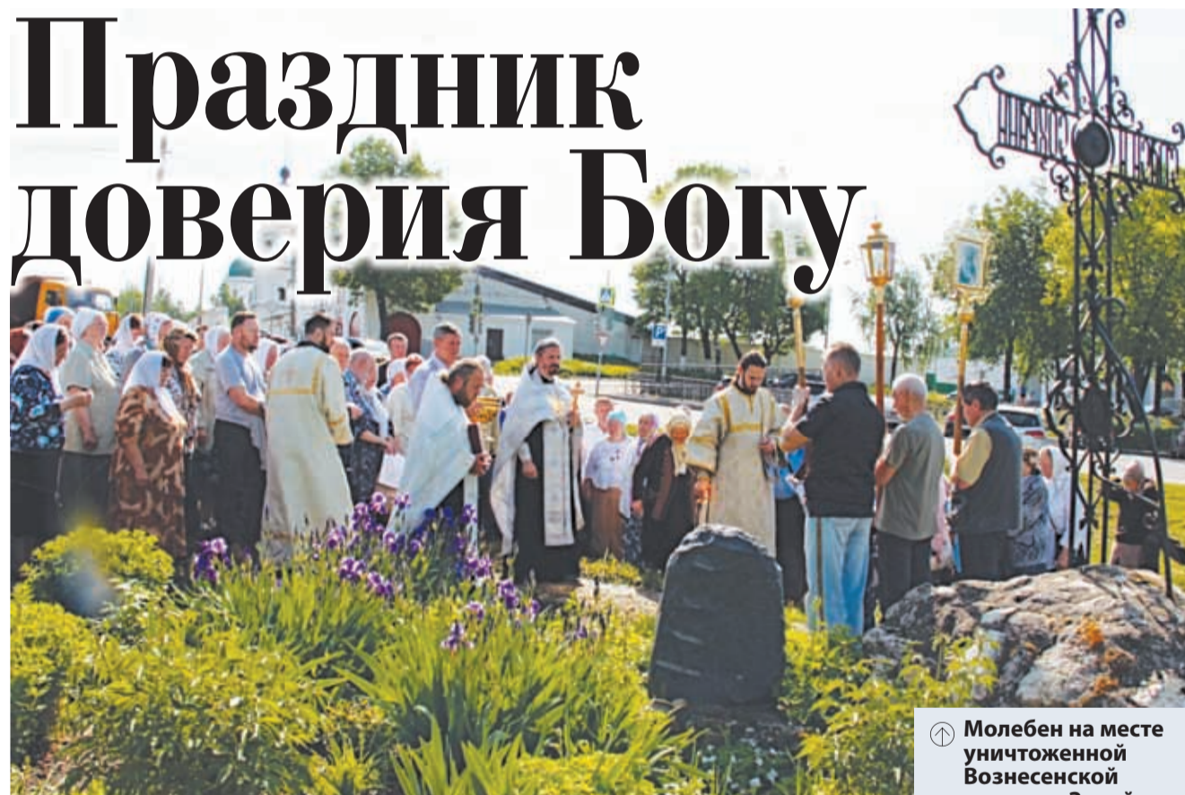
Молебен на месте уничтоженной Вознесенской церкви г. Зарайска