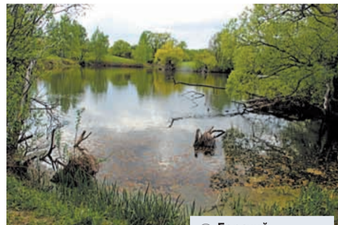
⊕ Барский пруд в Ильицыне