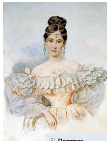
⊕ Портрет Н.Н. Пушкиной А. Брюллова

Всего в Зарайском уезде Пушкиным и Гончаровым принадлежала одна десятая часть всех его земель! Вот к каким далёким временам относятся, видимо, близкие отношения Пушкиных и Гончаровых. По устным зарайским пре-