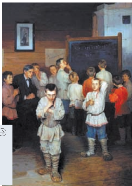
Сюжет картины Н. Богданова-Бельского «Устный счёт», написанной в 1895 году, невероятно правдиво передаёт обстановку в сельской школе.