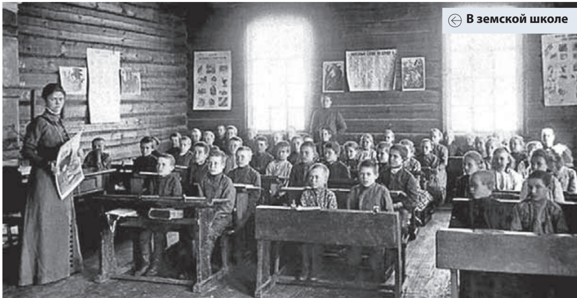
В земской школе