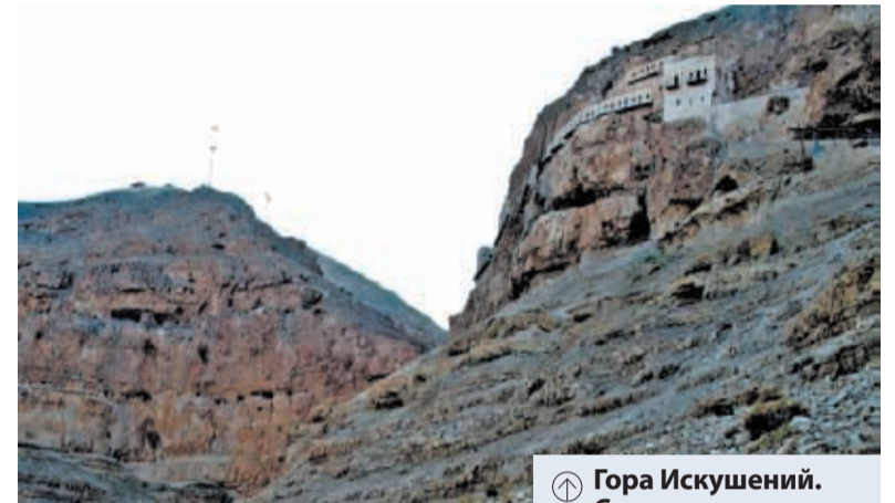
↑ Гора Искушений. Справа — окна ряда монашеских келий

...От путешествия по Израилю в 2007 году у меня остались очень сильные впечатления, фотографии и путевые заметки. К 13 декабря, скажем, относятся следующие строки: «От монастыря св. Герасима Иорданского едем к Иерихону. Иерихонская долина расположена на 200 метров ниже уровня моря. Над городом возвышается Гора Искушений; её высота 800-1000 метров. На склоне горы видим кельи монастыря; к нему идут паломники по серпантину дороги... Вторая половина дня, солнечно, на небе — ни облачка, нам очень жарко. Экскурсовод объясняет, что здесь температура выше, чем в Иерусалиме (а он совсем недалеко), градусов на десять. Идём, тяжело дыша, читая Иисусову молитву. И хотя к монастырю проложена канатная дорога, нам хочется преодолеть подъём своими ногами... Со скалы открыва-