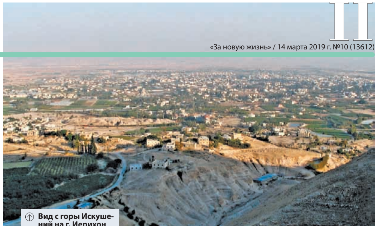
↑ Вид с горы Искушений на г. Иерихон

По примеру поста Спасителя, Православной Церковью установлен сорокадневный пост, который называется Великим и начинается за семь недель до праздника Пасхи. Пост помогает человеку очистить себя от зла — от греховных наклонностей, помогает больше помнить о Боге и быть ближе к Нему.