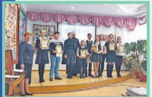
С 26 ноября по 21 декабря проходили мероприятия XVI муниципальных Рождественских Образовательных чтений на тему «Молодёжь: свобода и ответственность».