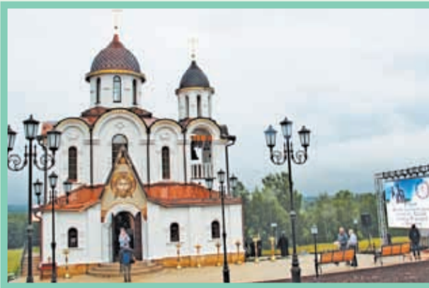
8 июля в д. Протекино состоялось Великое освящение нового храма в честь святителя Василия Рязанского, построенного на средства благотворителей. Торжество возглавил Управляющий Московской епархией митрополит Крутицкий и Коломенский Ювеналий.