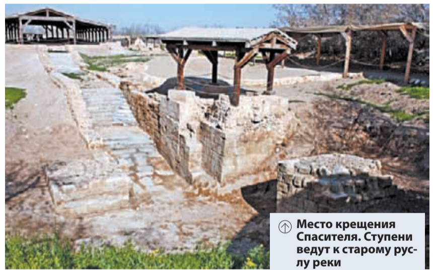
Ⓜ Место крещения Спасителя. Ступени ведут к старому руслу реки