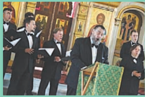
С 22 по 31 мая проходили мероприятия XV Бахрушинского фестиваля.