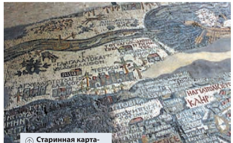
Ⓜ Старинная карта-панно на полу храма в Мадабе

До недавнего времени достоверное место Крещения Господа было неизвестно. «Подсказкой» стало мозаичное панно на полу православной церкви вмч. Георгия в иорданском городе Мадаба, которое изображает карту древней Святой Земли и, в частности, указывает на место Крещения Иисуса Христа. Новейшие археологические раскопки показали, что произошло оно на восточном берегу реки, близ нынешнего иорданского посёлка Вади-эль-Харар (с арабского — «журчащая вода»). Исследуя там развалины византийской церкви, учёные нашли каменные ступени, спускающиеся прямо к старому руслу реки, и мраморное основание колонны, часто упоминавшейся древними паломниками. Плита найдена на сорок метров восточнее сегодняшнего берега Иордана, что вполне соответствует выводам учёных о том, что в V веке