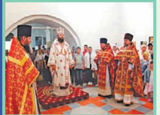
29 августа в часовне новомучеников и исповедников Российских д. Воронино впервые состоялась Божественная литургия.