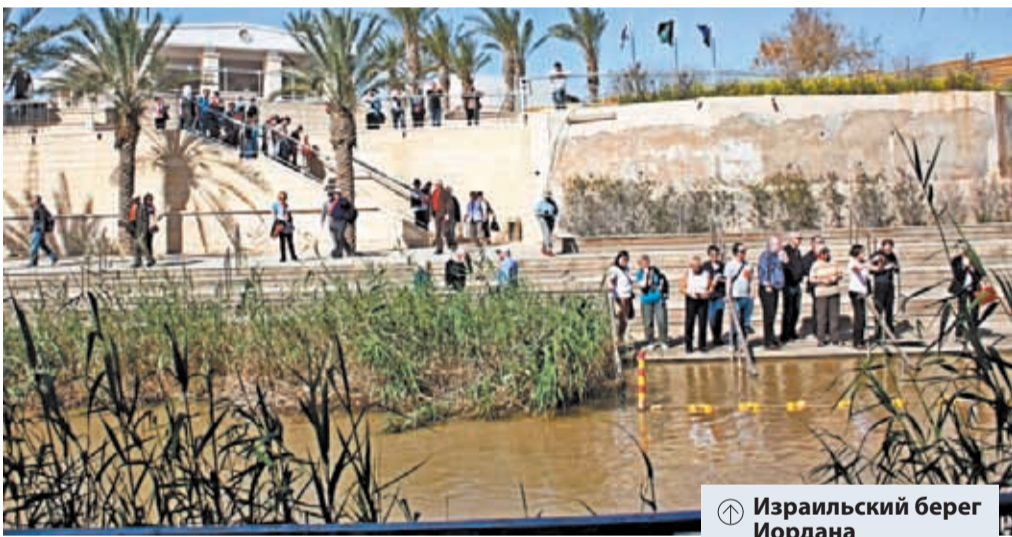
Ⓜ Израильский берег Иордана

В день Богоявления по традиции «ходят на Иордан», т.е. совершаются крестные шествия из церкви на реку, озеро, источник, чтобы освятить там воду. Некоторые потом окунаются в проруби, омываясь ледяной крещенской водой.