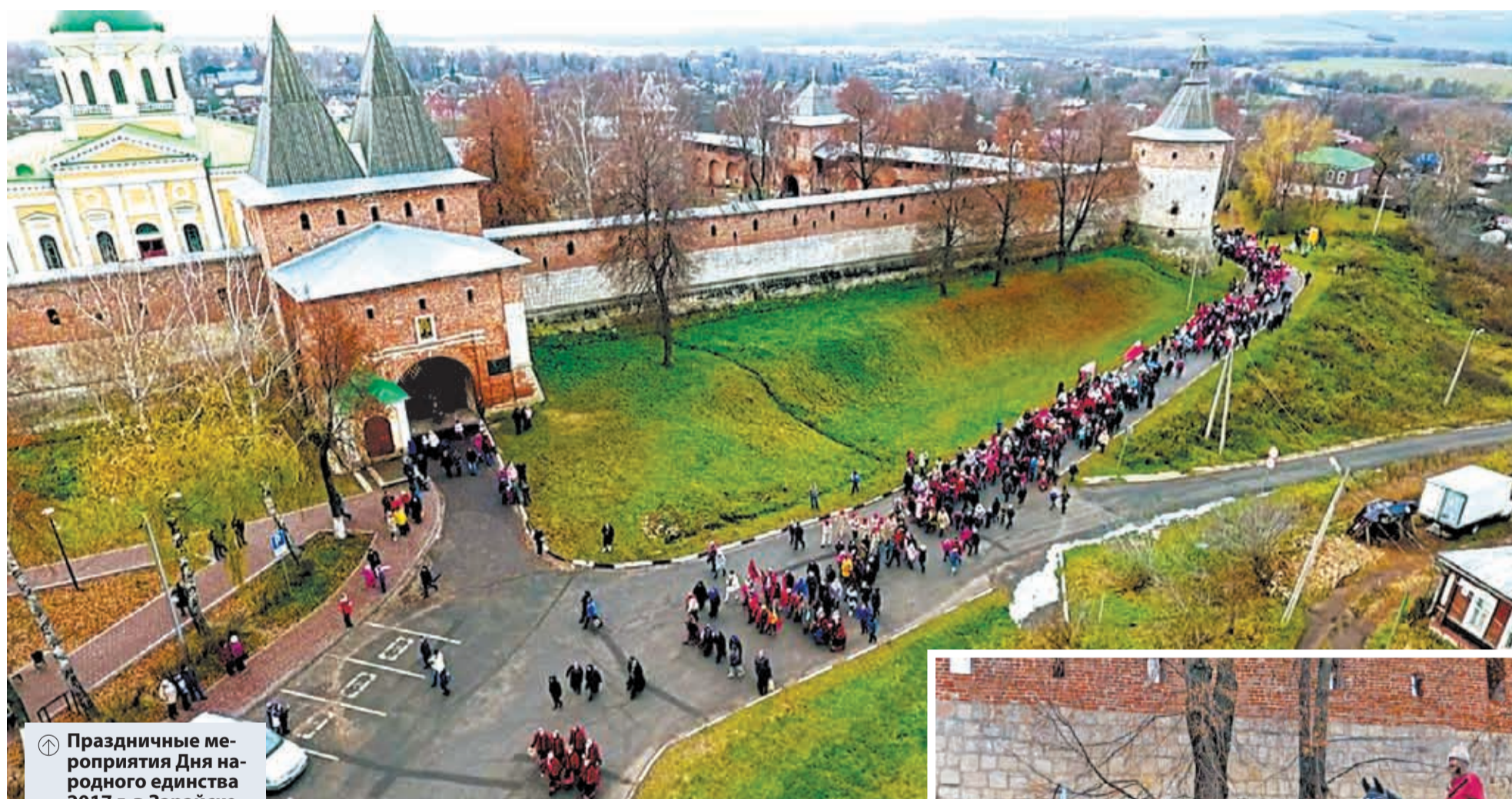
⌚ Праздничные мероприятия Дня народного единства 2017 г. в Зарайске

У нас многонациональная страна, и вопрос единства для нас имеет и будет иметь всегда колоссальное значение. У нас просто нет иного выбора: для того чтобы сохранить страну, мы должны сохранить единство историческое, духовное, территориальное. Сможем возродить единство — сможем энергично развиваться в дальнейшем.