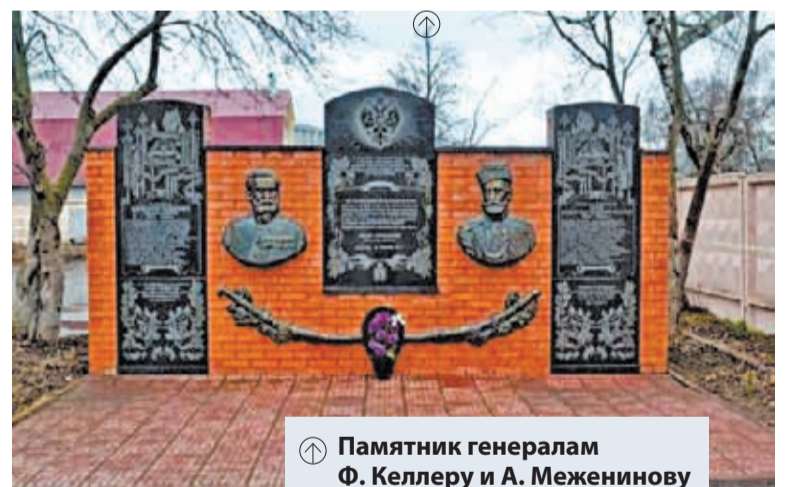
Памятник генералам Ф. Келлеру и А. Меженинову в Зарайске