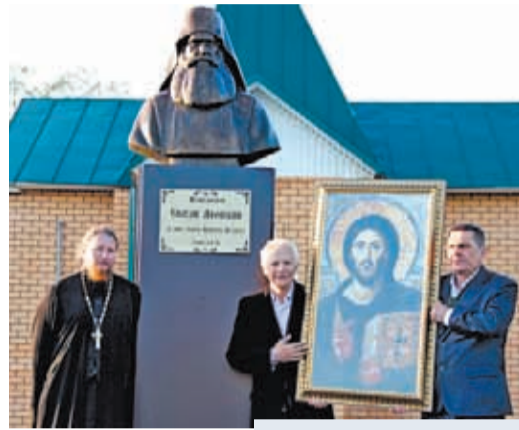
Группа зарайцев у памятника прп. Силуану в с. Шовское

на завидного жениха. Однажды, после нецеломудренно проведённого времени, он задремал и в состоянии лёгкого сна увидел, что змея через рот проникла внутрь его. Он ощутил сильнейшее омерзение и проснулся. В это время он услышал слова: «Ты проглотил змею во сне, и тебе противно; так Мне нехорошо смотреть, что ты делаешь». Голос был необыкновенной красоты, и юноша почему-то понял, что с ним говорила Пресвятая Дева. До конца своих дней он благодарил Божию Матерь, что Она не возгнушалась им, но Сама благоволила посетить его и восстановить от падения. Он говорил: «Теперь я вижу, как Господу и Божией Матери жалко народ. Подумайте, Божия Матерь пришла с небес вразумить меня, юношу, во грехах».