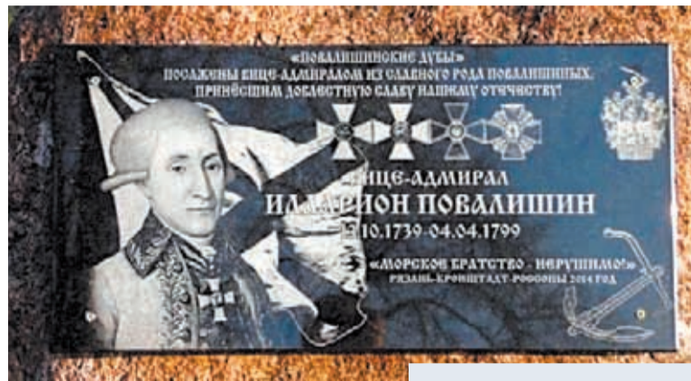
⬆ Мемориальная доска И.А. Повалишину, установленная в Янковичах

После Красногогорского сражения шведский флот оказался заблокированным в Финском заливе под Выборгом. Повалишину поставили особую задачу — отрядом из шести кораблей перекрыть западный выход из залива. 22 июня 1790 г. отряд принял основной удар шведского флота, идущего на прорыв. Корабли неприятеля, яростно