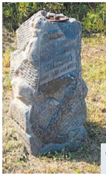
⊖ Памятник Н.Ф. Повалишину в д. Астрямьево

Среди святынь сельского храма исторические документы отмечают Казанскую, Иверскую, Знаменскую, Страстную иконы