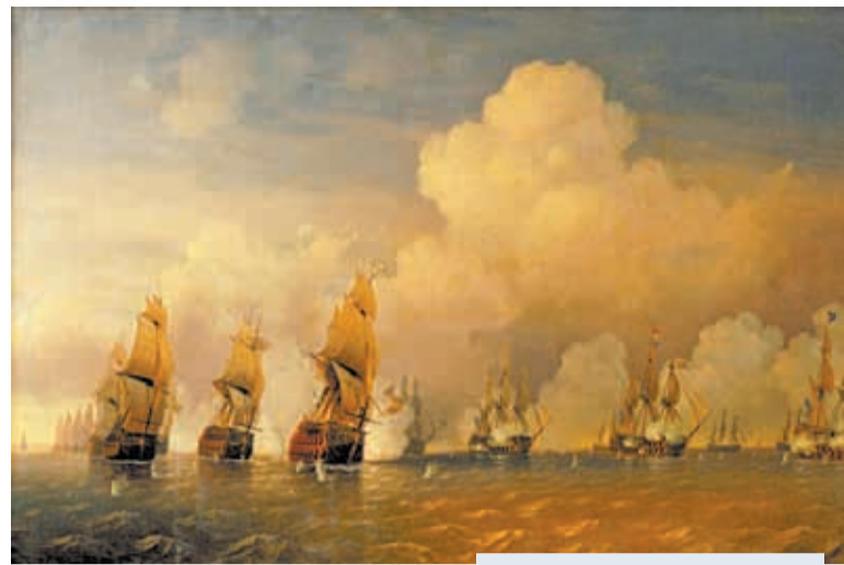
⊕ Картина А.П. Боголюбова «Сражение при Красной Горке»

История села Астрямьево насчитывает несколько веков. Первоначально здесь стояла церковь в честь св. Димитрия Солунского. Затем на её месте была построена деревянная Казанская церковь, которая в 1818 году сгорела. Вскоре на-