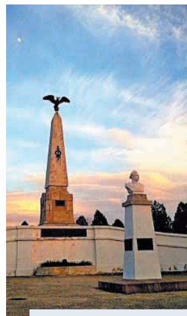
⬆ г. Севастополь. Памятник на 3-м бастионе