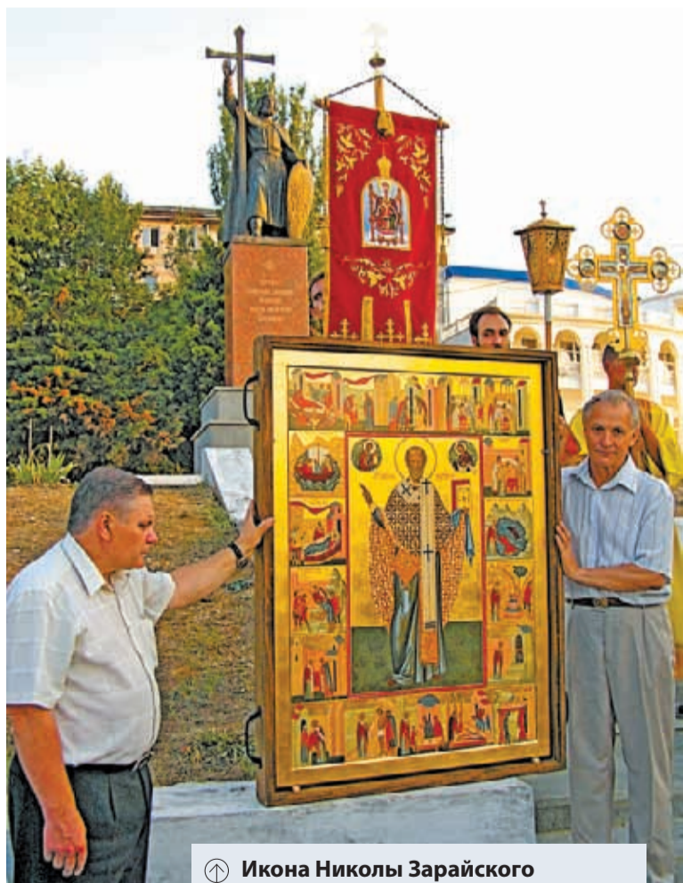
Икона Николая Зарайского в Севастополе. Август 2006 г.