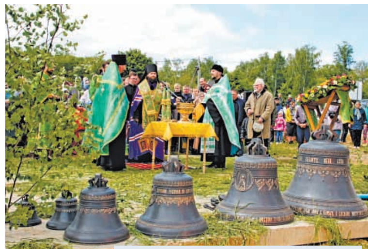
⌚ Праздник Святой Троицы 2017 г. Чин освящения крестов и колоколов совершил епископ Луховицкий Пётр