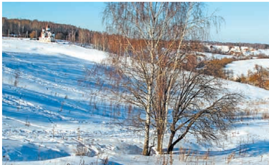
⌚ Храм в деревне Протекино построен на живописном берегу реки Осётр