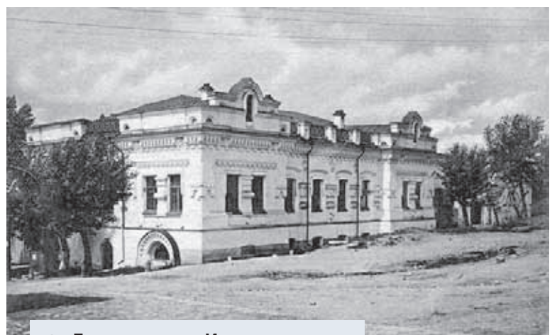
Дом инженера Ипатьева, снесённый в 1977 г.