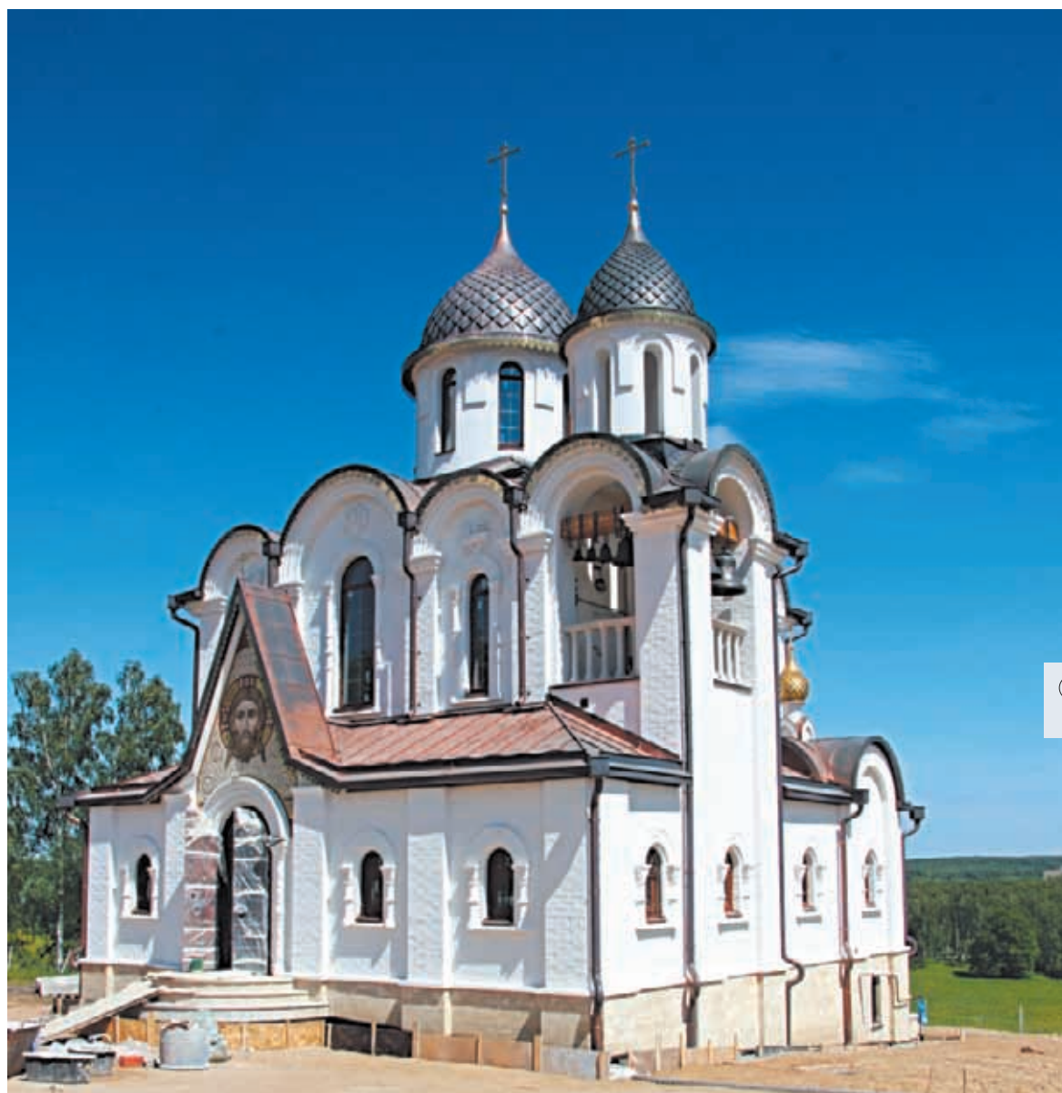
⌚ Храм святителя Василия Рязанского. Июнь 2018 г.