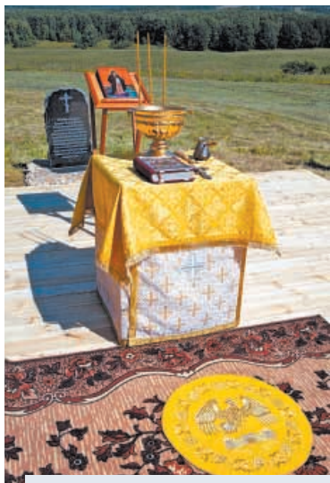
⌚ 11 августа 2015 года. Перед освящением закладного камня