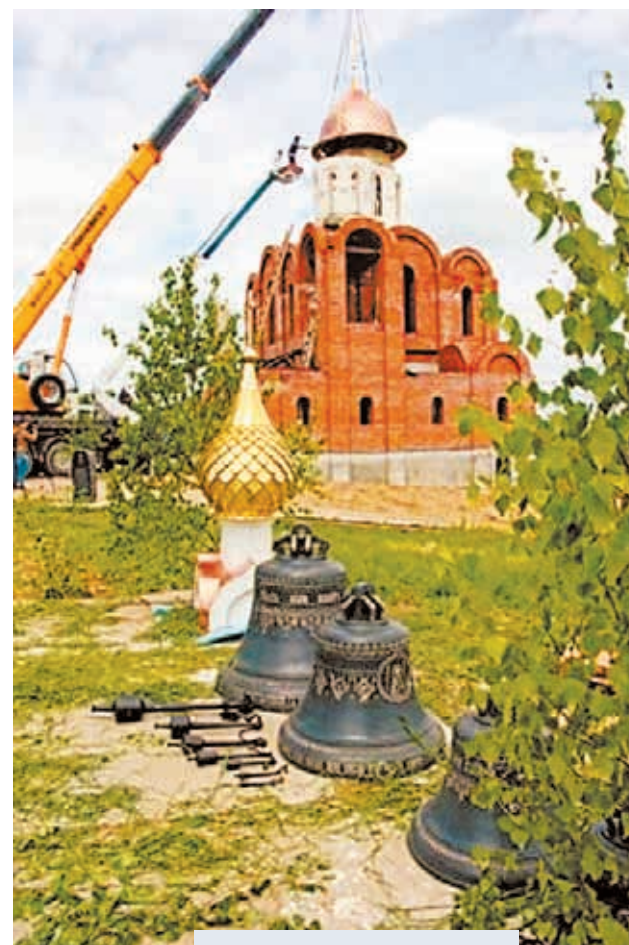
⌚ Установка купола. Июнь 2017 г.