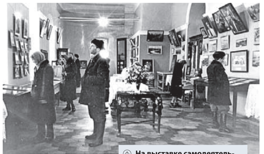
Ⓜ На выставке самодельных художников