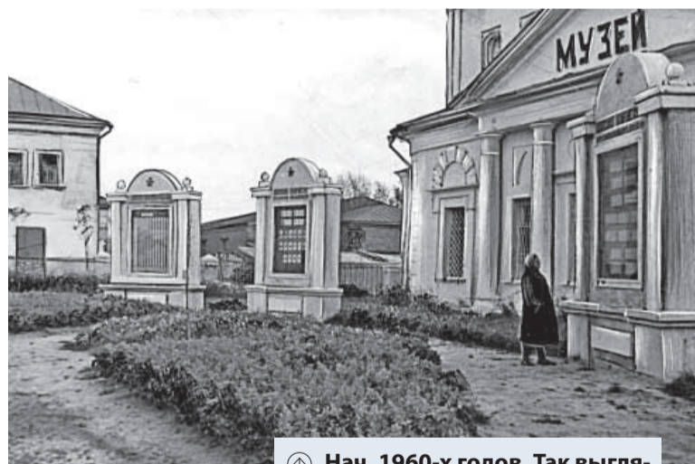
Ⓜ Нач. 1960-х годов. Так выглядел северный фасад храма