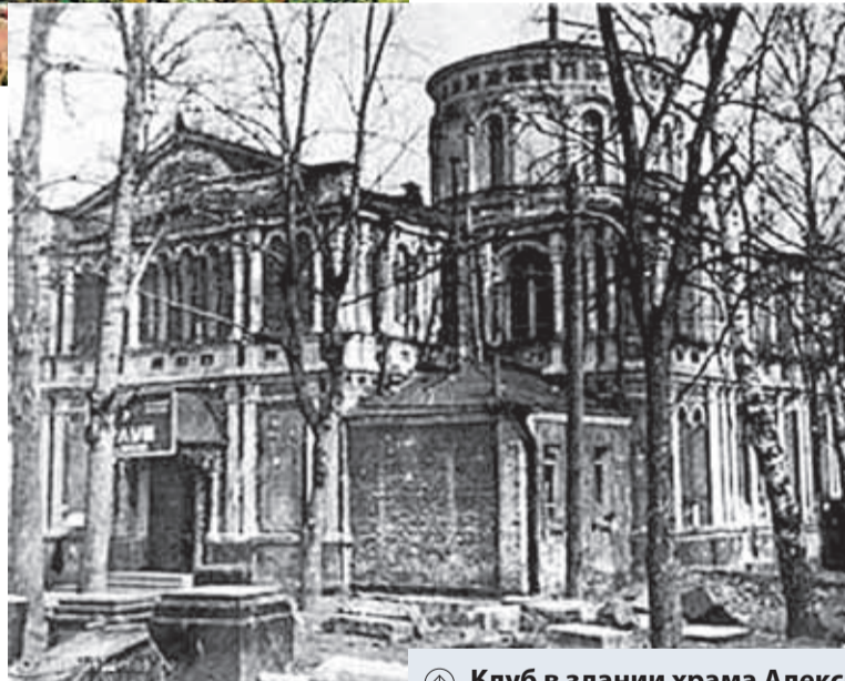
⊕ Клуб в здании храма Алексия, человека Божия