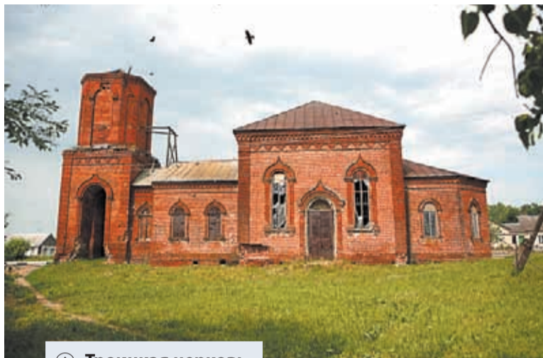
Троицкая церковь в Зимёнках. 2007 г.