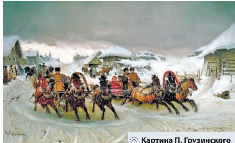
Картина П. Грузинского «Масленица», 1889 г.

В Зарайском уезде, так же, как и во всей матушке-России, блины на Масленице едят за завтраком, а завтрак в зимнюю пору у простого русского народа чуть не до света. В последние дни масленичной недели после завтрака и после обеда запрягаются тройками, парами и одиночками розвальни 1 и пошевни 2 , и в них бабы и девки, засевавши целыми