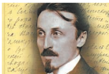
⬆ Борис Зайцев