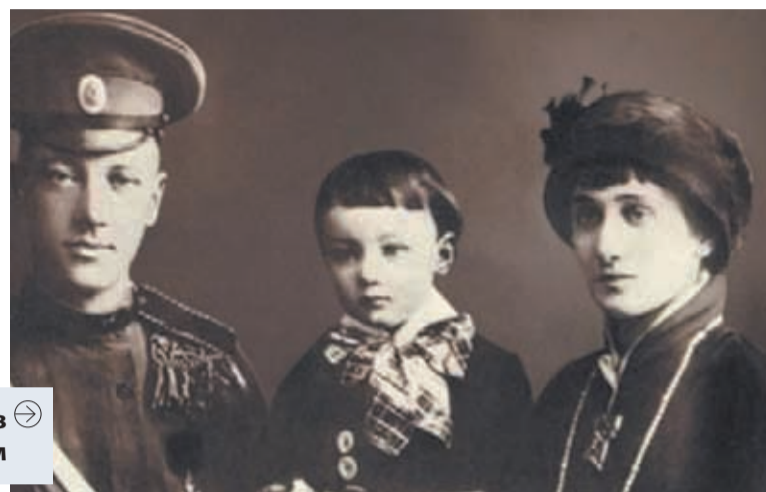
⬆ Николай Гумилёв и Анна Ахматова с сыном