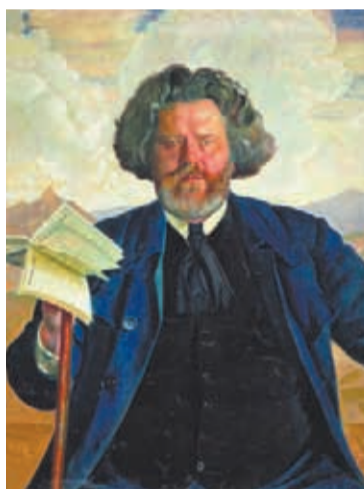
⬆ Максимилиан Волошин