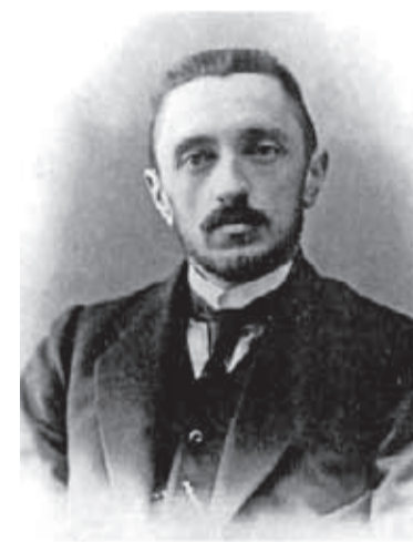
⬆ Иван Шмелёв