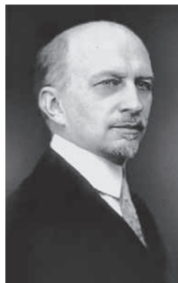
⬆ Иван Ильин