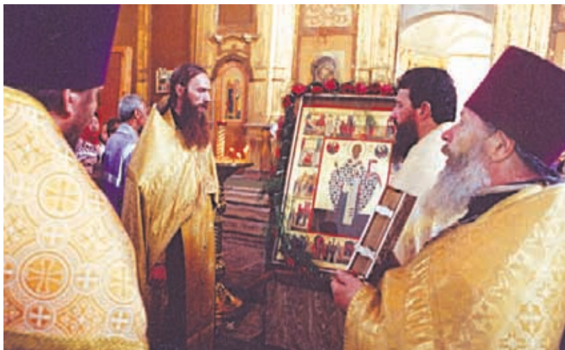
Молебен в день престольного праздника. 11 августа 2001 г.