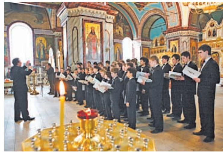
Концерт Пасхального фестиваля. 2008 г.