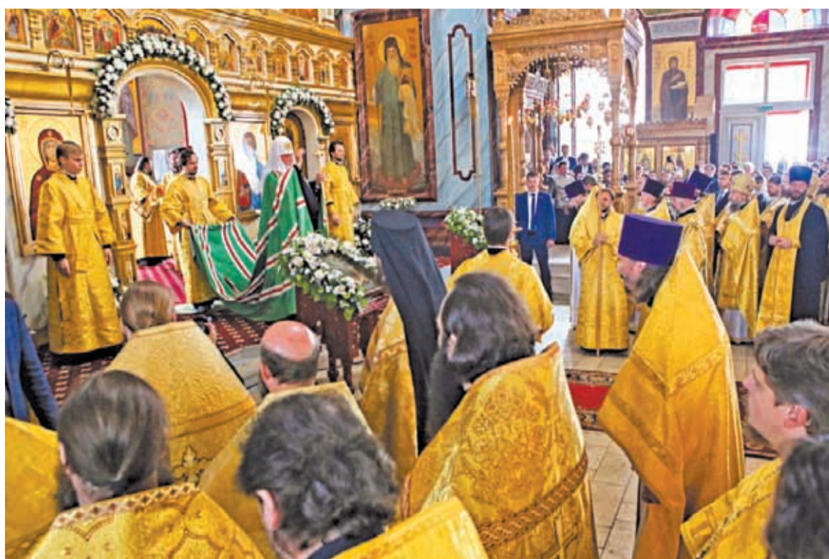
Святейший Патриарх Московский и всея Руси Кирилл совершает Божественную литургию в Иоанно-Предтеченском соборе г. Зарайска. 14 августа 2016 г.

Казанская икона Божией Матери пользуется в России беспрецедентным почитанием. Обычно именно этой иконой благословляют молодых к венцу, именно её вешают у детских кроваток, чтобы кроткий лик Богородицы с любовью смотрел на юных христиан.