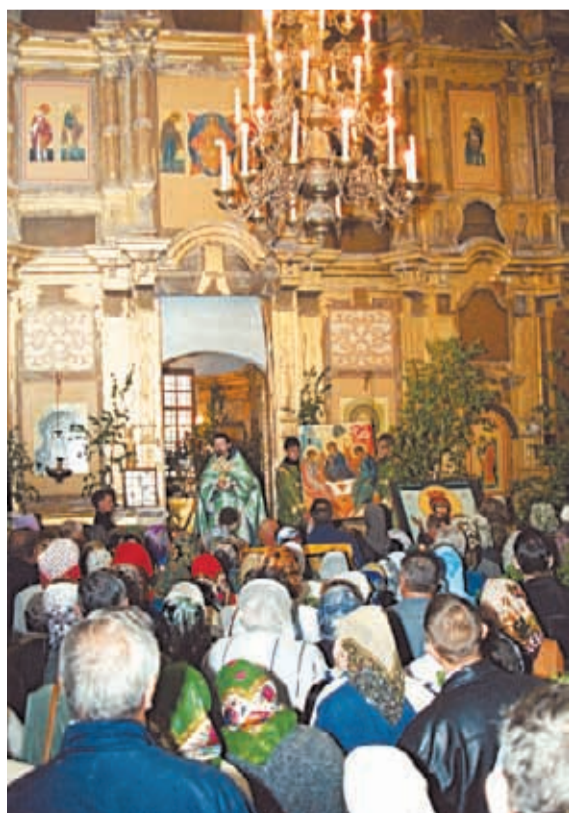
Праздник в честь Святой Троицы в Никольском соборе. 2004 г.