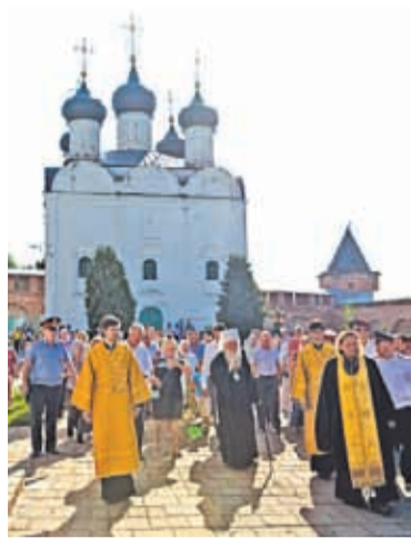
Встреча владыки Ювеналия 11 августа 2013 г.