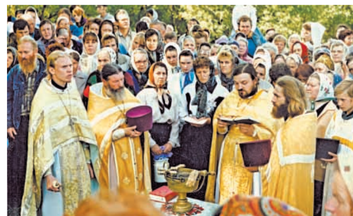
Молитба на Белом Колодце 11 августа 1997 г.

Устрашённые ополчением Минина и Пожарского, поляки бежали из Москвы. В первый же воскресный день земская рать и все обитатели столицы совершили торжественный крестный ход на Лобное место с Казанской иконой, в чьей чудотворной силе они убедились воочию.