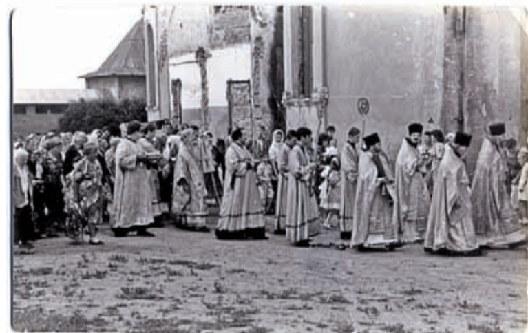
Первый крестный ход

На своё историческое место вернулась чудотворная икона Николы Зарайского, которая, как и прежде, привлекает отов-