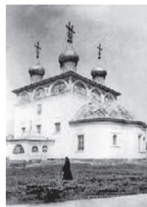
Старинные фотографии и пасхальные открытки