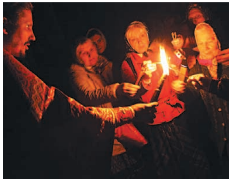
В последние годы Благодатный огонь из Иерусалима доставляется в российские храмы на пасхальные богослужения

С тех пор никто не дерзает оспаривать у православных право получения Святого огня. Треснувшая колонна стоит на том же месте поныне и молчаливо свидетельствует об этом чуде, обличая врагов православия и утверждая верных в истине.