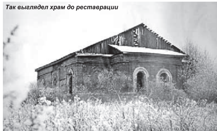
Так выглядел храм до реставрации