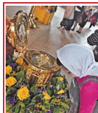
Перед ковчегом с частицей мощей Николая Чудотворца

— Светить самой для этого человека. И чем больше усилий ты будешь прикладывать, чтобы светить, тем больше света тебе дастся! Запомни, свет — это не только разговоры о вере и Боге. Свет — это приветливая улыбка, доброе слово, поддержка и помощь.