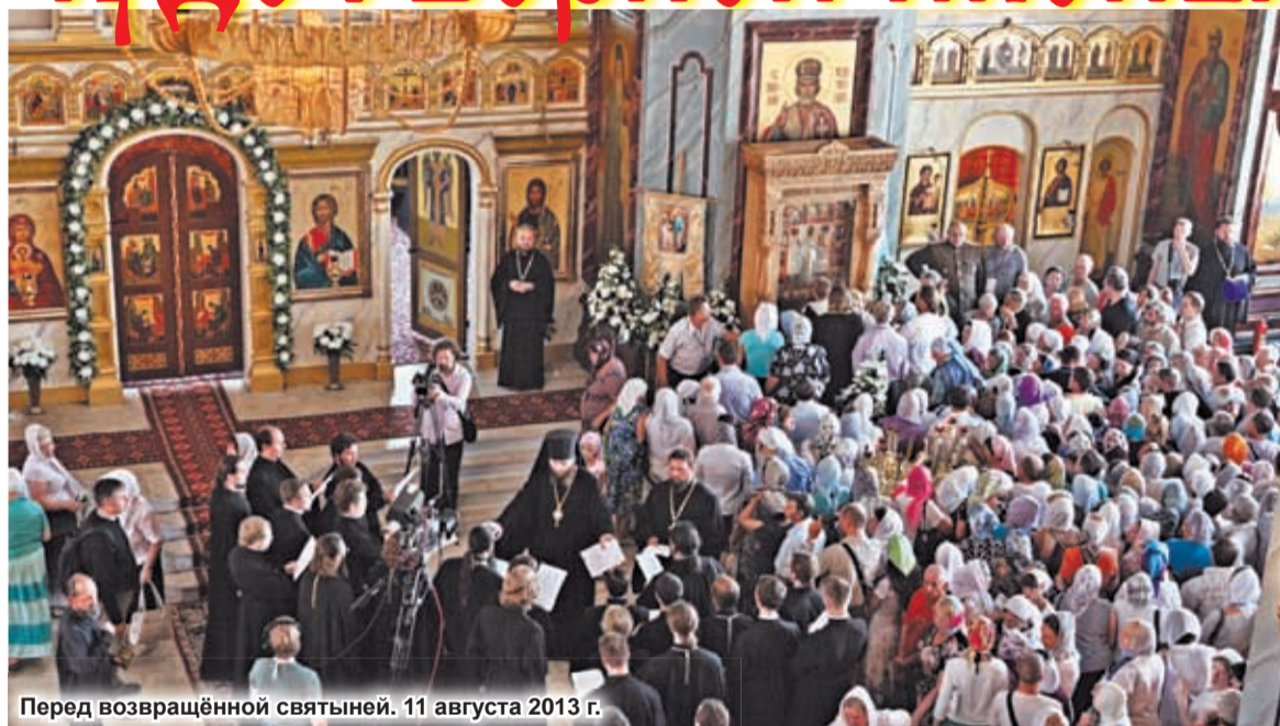
Перед возвращённой святыней. 11 августа 2013 г.